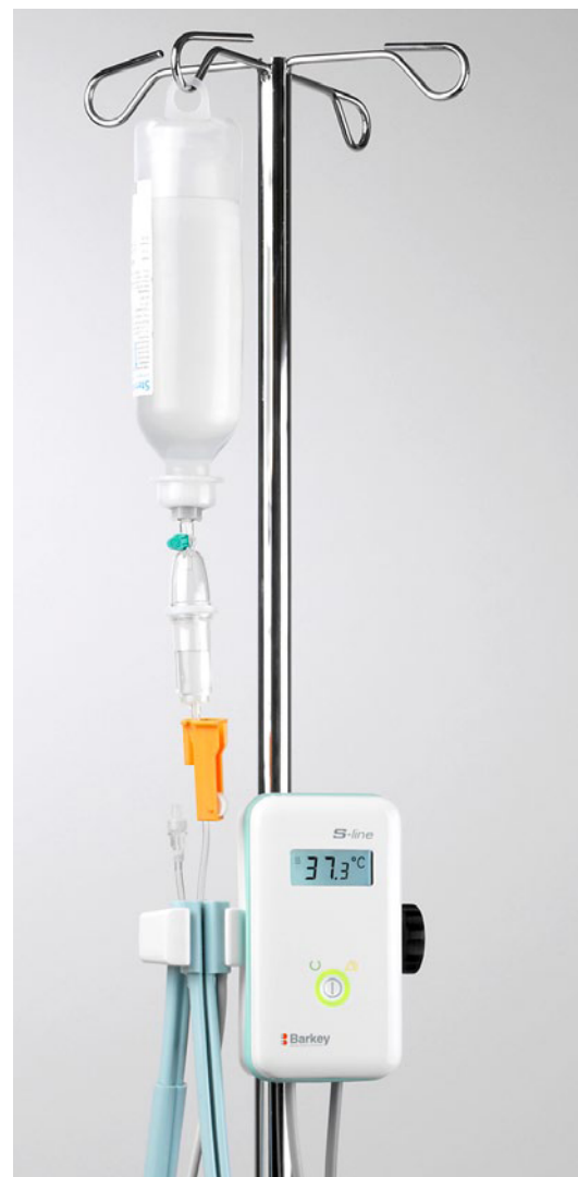
Tilbehøret vist på billedet er ikke inkluderet i leverancen